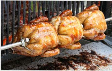
GOCKEL UND SCHWEINSHAXEN ZUM MITNEHMEN

HALBER GOCKEL 6,00 EUR MIT POMMES 9,00 EUR